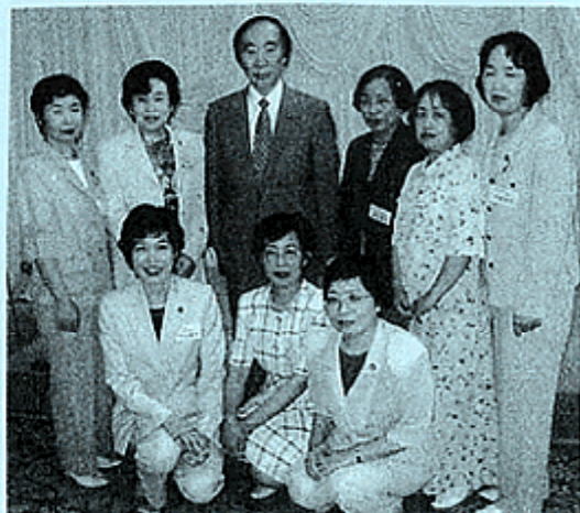
（左から奥の列が長女と次女、前が孫と姪、右の列が母と妹）

今後ますます政党の真価を問われる大事な局面を迎えますが、常に皆様の血のにじむようなご支援を忘れず、生活者の目線を第一義としてマニフェスト実現に、私達地方議員もしっかりと全力で取組んで参ります。尚一層のご支援の程よろしくお願い申し上げます。